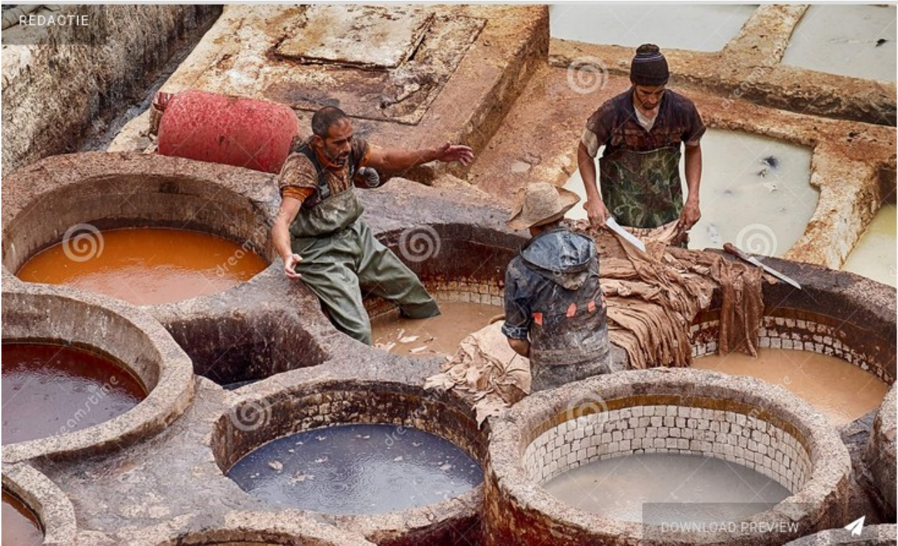
Figuur 6 Leerlooierij in Marakesh