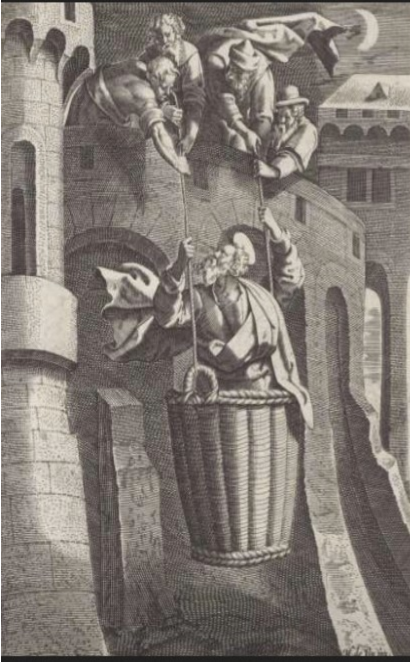
figuur 5 Paulus ontsnapt in de mand uit Damascus