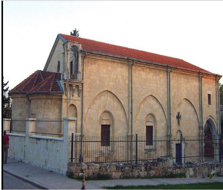
Prent 3 Pauluskerk uit de 12 e eeuw in Tarsus