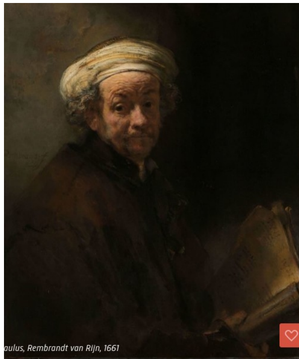
Paulus, Rembrandt van Rijn, 1661