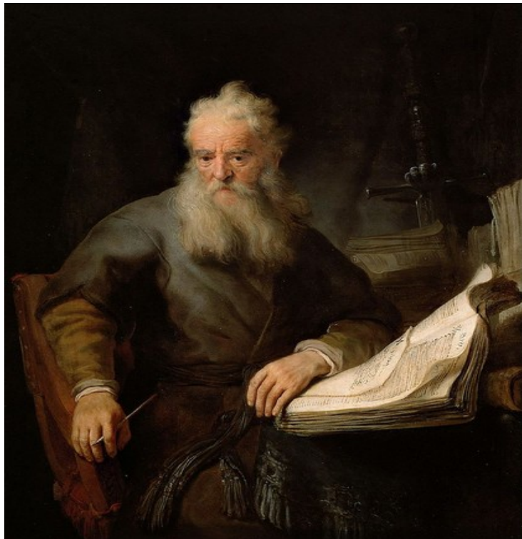
Figuur 4 Paulus schrijft zijn brieven