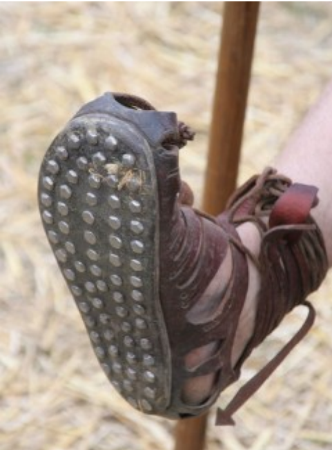
Figuur 7 Stapper van Jan de Legionair