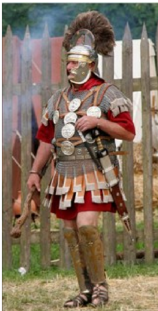
Figuur 8 De centurion in vol ornaat zonder schild