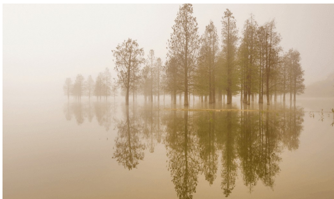
Moment van stilte

Tekst: Hans Maat, muziek: Tobias Plansoen. © Stichting Sela Music